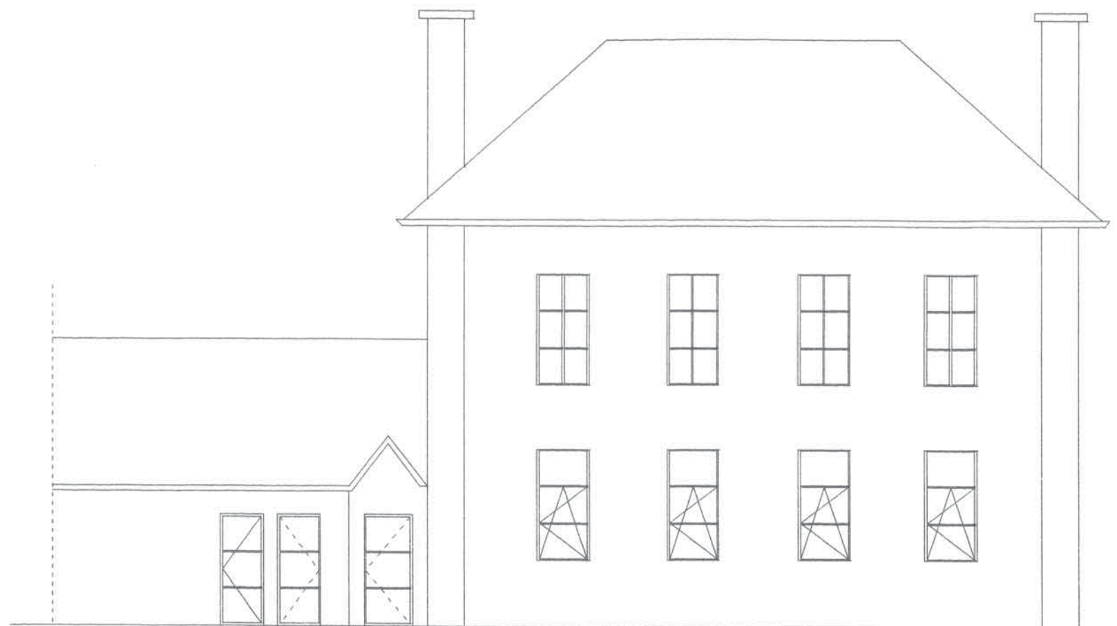
FACADE NORD-OUEST COTE RUE