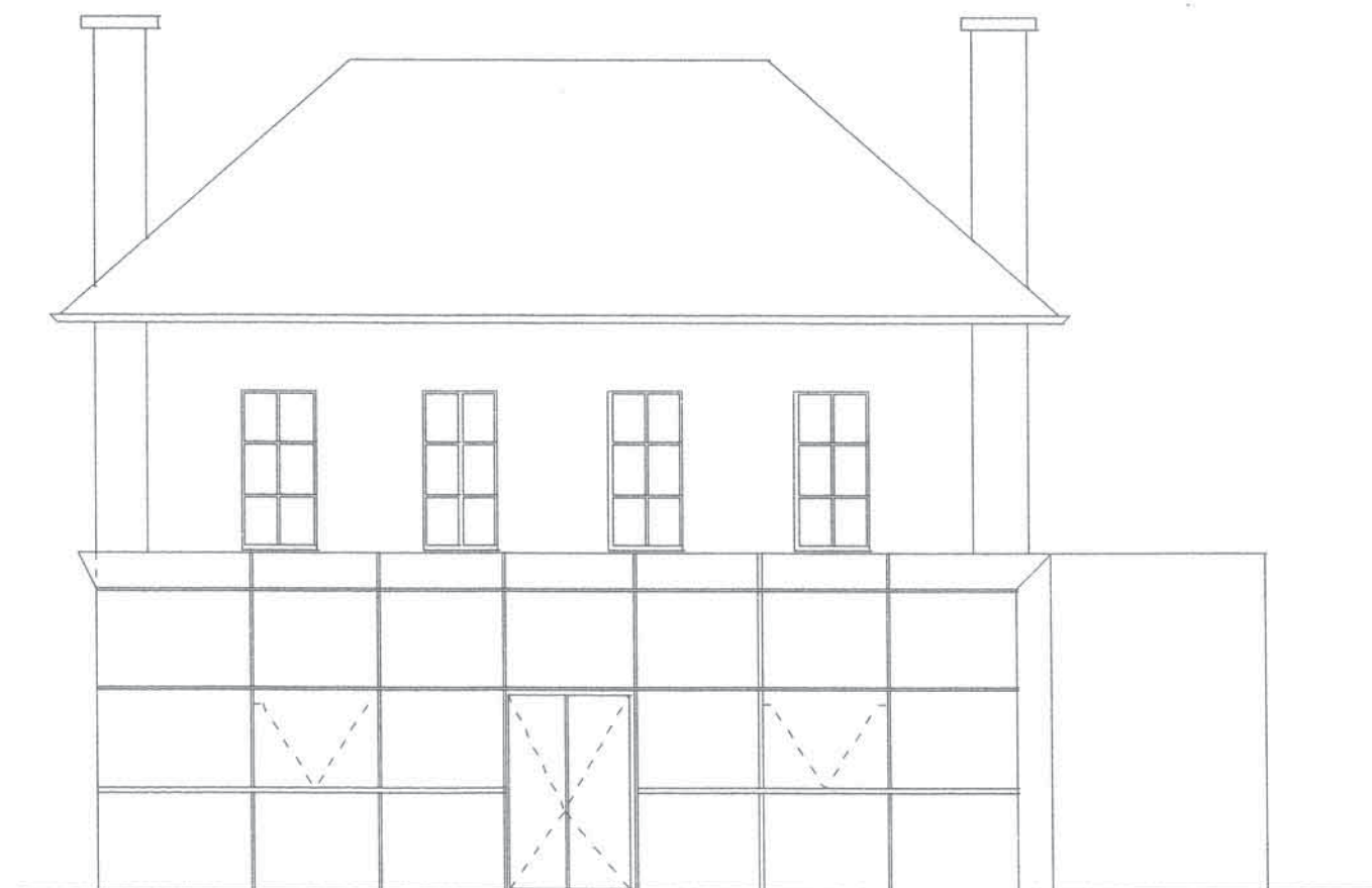
FACADE SUD-EST COTE JARDIN